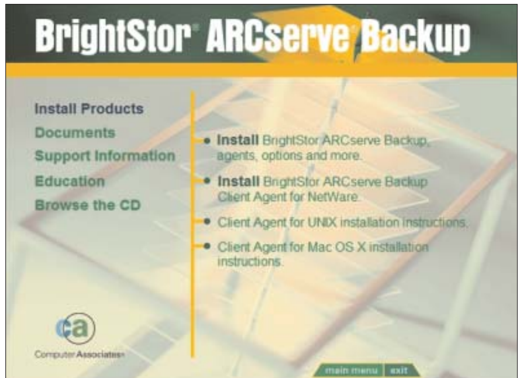
Abbildung 1. Alle Optionen und Agenten sind auf einer CD zu finden.